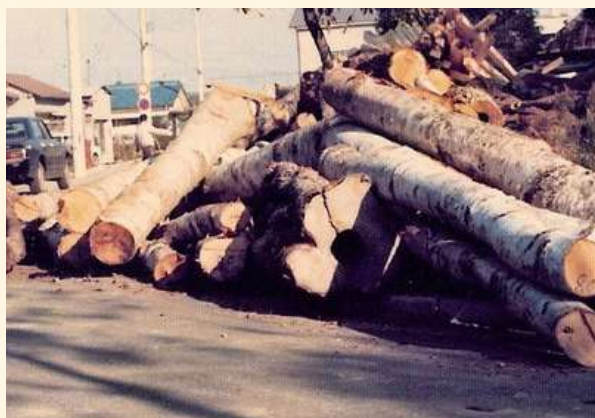
知床半島から運んだ原木