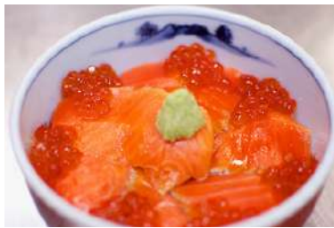
しれとこ 親子丼 3,000円