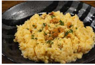
ウニの クリーム リゾット 3,500円