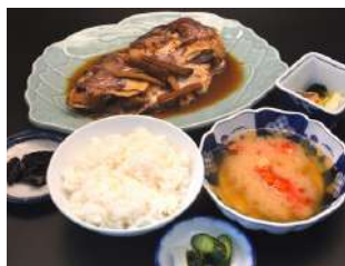
たいのかぶト煮定食 1,600円