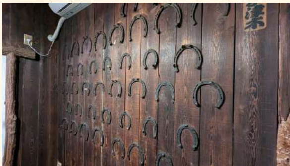
個室にはばん馬の蹄鉄