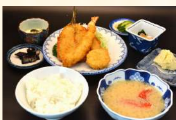
ミックスフライ定食