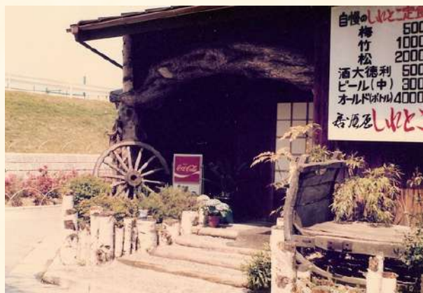
昭和51年当時の入口