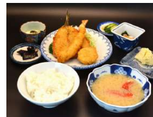
張り紙からお選びください 1,980円