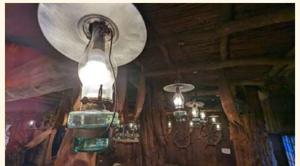
ランプは小樽の北一硝子製