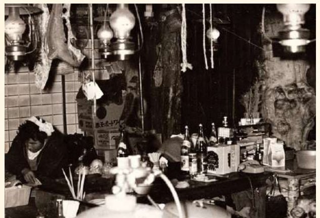
仕事後にくつろぐ漁師

当店は昭和35年（1960年）から北海道東川町で5年間、知床半島羅臼町で13年間観光客や漁師を相手とした飲食店を営んでおりました。