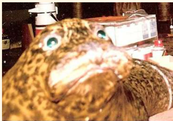
まだ毛があったアザラシ

昭和51年（1976年）5月22日ここ江戸川区新堀に開店しました。 羅臼で知り合った人脈を活かし、本場の味を東京で提供しよう。