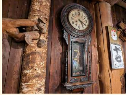
時計は北海道開拓時代の時計