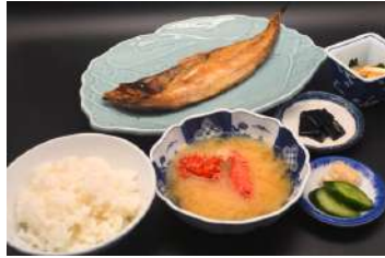
ホッケの開き定食 2,100円