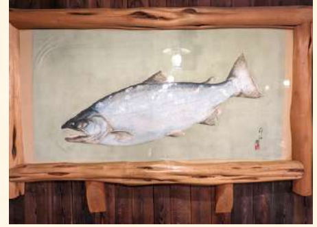
キングサーモンの絵に見えるこちらはカラー魚拓。