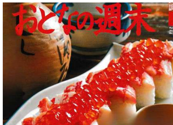
タラバとイクラ 4,500円 紅鮭 1,650円