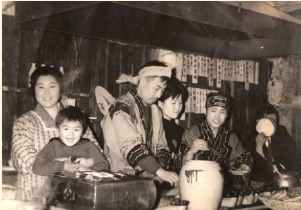
初代女将と二代目女将