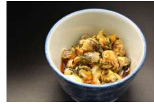
つぶ貝 生姜醤油和え 1,200円