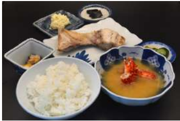
季節のカマ焼き定食 1,600円