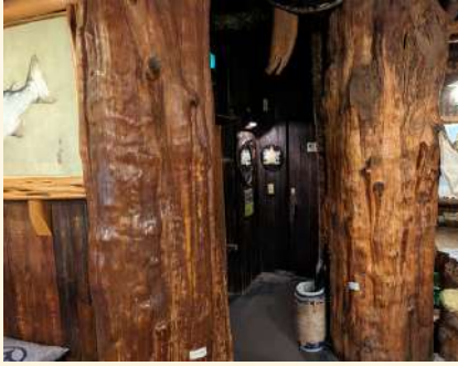
入口、イチイの木は樹齢約3,000年の木。当店で一番価値のある木です。雄と雌の木がございます。

当店の木は全て世界遺産、知床半島から運び出された丸太です。極寒の地でこの太さまで育つにはとてつもない年月を要するといわれております。